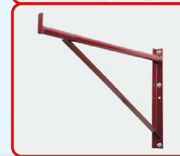
狗臂架必須裝上最少三顆繫穩螺絲