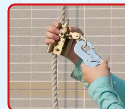
獨立救生繩及防墮裝置