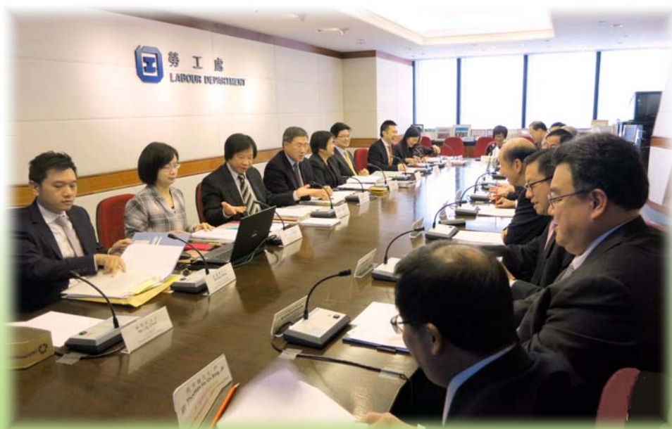
勞工顧問委員會會議

2.16 勞工處透過不同的顧問委員會就勞工事務進行諮詢，其中最重要的是勞顧會。勞顧會是一個高層次及具代表性的三方諮詢組織，就有關勞工的事宜（包括法例及國際勞工組織的公約和建議書）提供意見。勞顧會的委員包括僱員及僱主代表，並由勞工處處長出任主席，其職權範圍、成員組織及二零一三至二零一四年度的成員名單載列於圖二·三。