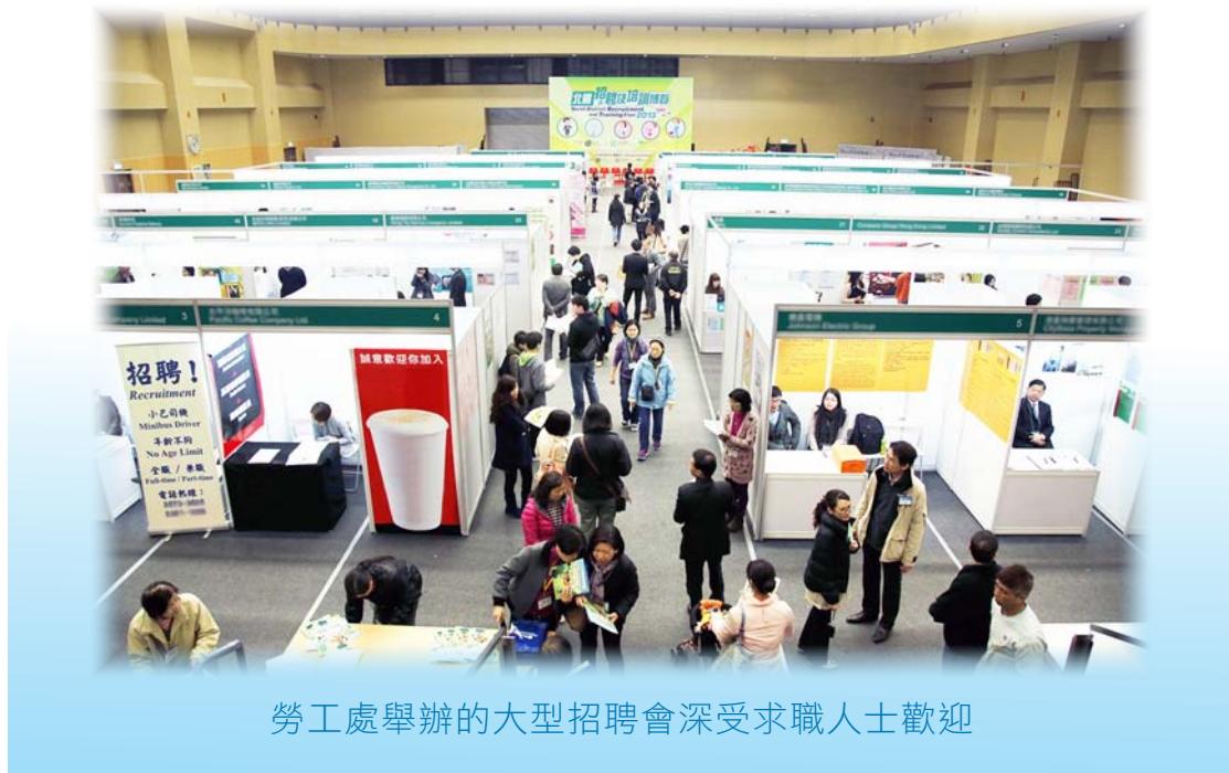
勞工處舉辦的大型招聘會深受求職人士歡迎