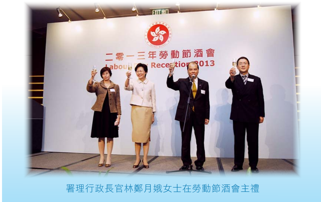
署理行政長官林鄭月娥女士在勞動節酒會主禮

1.29 勞工及福利局局長張建宗於二零一三年四月二十六日在香港會議展覽中心舉行勞動節酒會，表揚勞工界的貢獻。酒會由署理行政長官林鄭月娥主禮，出席嘉賓包括職工會、僱主聯會和其他機構的代表。