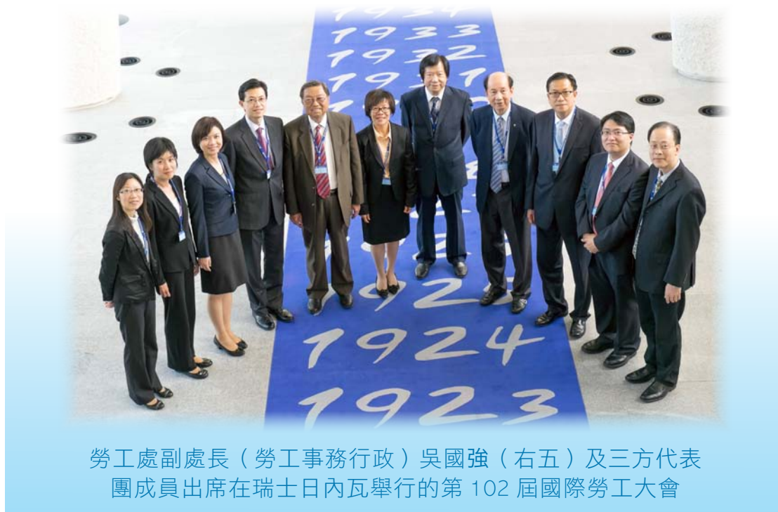
勞工處副處長(勞工事務行政)吳國強(右五)及三方代表團成員出席在瑞士日內瓦舉行的第102屆國際勞工大會