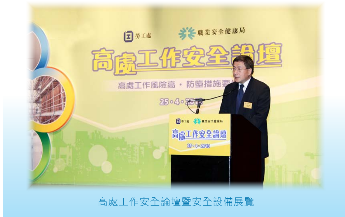
高處工作安全論壇暨安全設備展覽