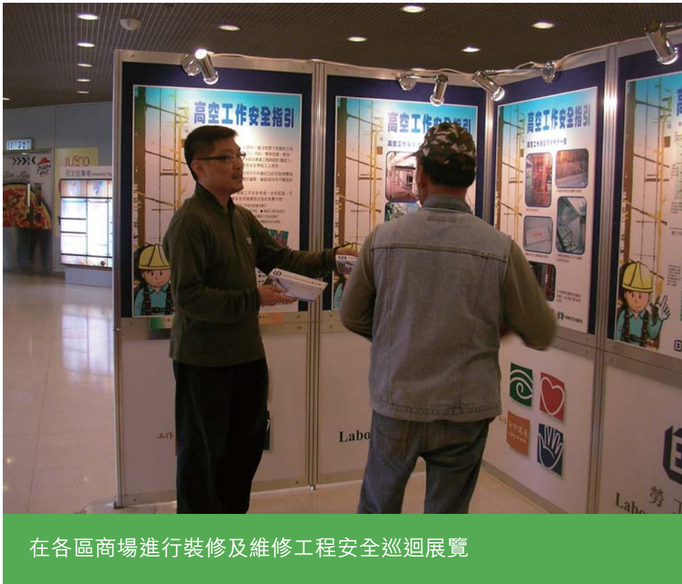
在各區商場進行裝修及維修工程安全巡迴展覽