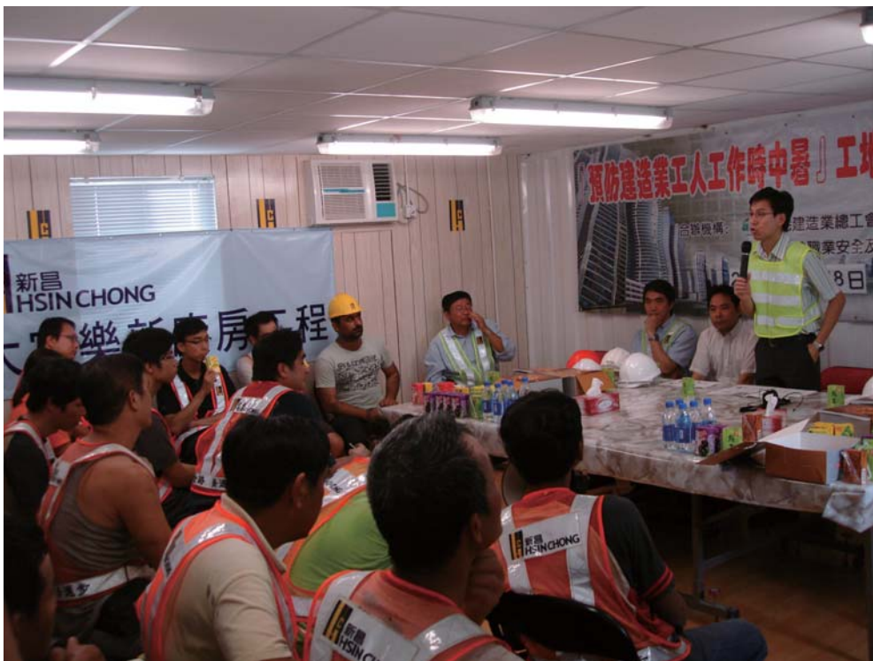
為地盤工人進行實地健康講座

1.28 為確保工人得到充分保障以防在夏天工作時中暑，在四月至九月期間，我們加強了宣傳及執法工作。除了向僱主及僱員推廣預防中暑的認知，我們亦派發「酷熱環境下工作預防中暑」指引及推廣適用於一般情況的「預防工作時中暑的風險評估核對表」。年內，我們亦與職安局和有關的職工會等合作，向職業司機宣傳推廣預防工作時中暑的信息。此外，我們亦加強巡查中暑風險較高的工作場所。巡查事項包括供應足夠的飲用水、提供有遮蔭上蓋的工作和休息地點、通風設施，以及為僱員提供適當的資料、指導及訓練等。