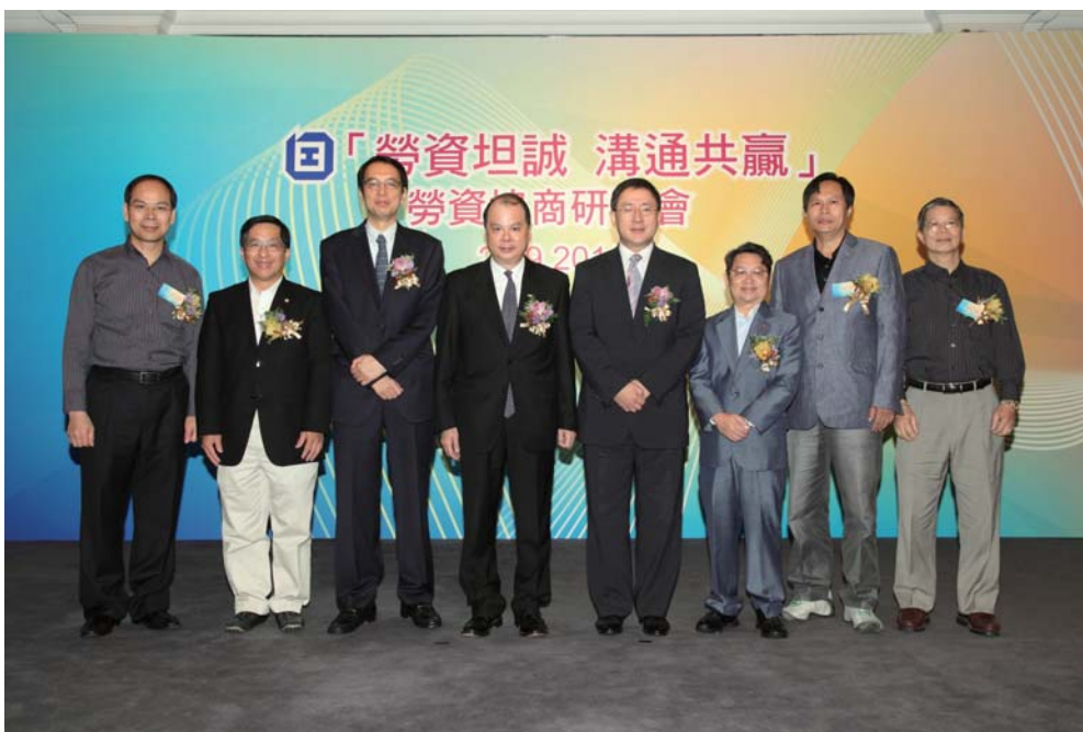
「勞資坦誠 溝通共贏」勞資協商研討會