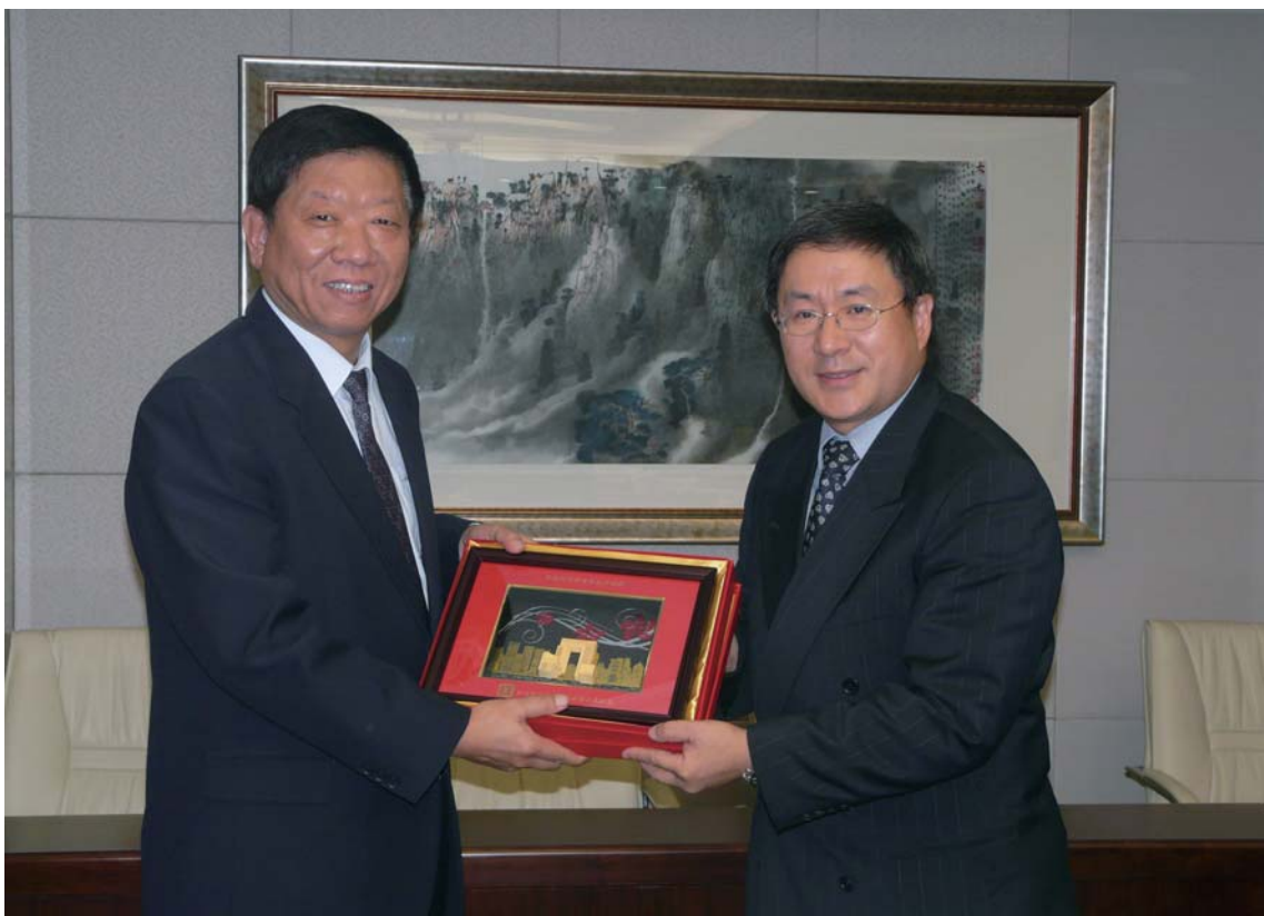
勞工處處長卓永興（右）與人力資源和社會保障部尹蔚民部長（左）會面

1.32 十月，勞工處處長卓永興按互訪計劃率領代表團到北京訪問國務院人力資源和社會保障部，並拜會尹蔚民部長。代表團亦拜訪了國家安全生產監督管理總局、中華全國總工會、中國企業聯合會及國際勞工組織北京局，就勞工事務及職業安全等課題進行交流。