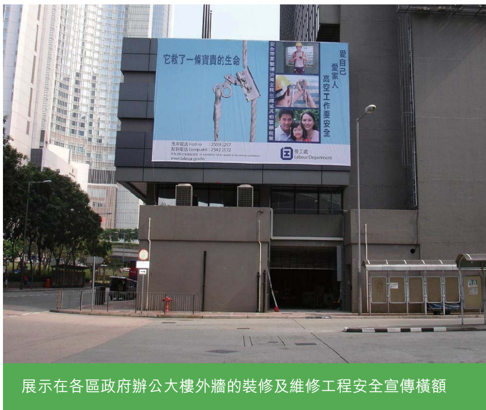
展示在各區政府辦公大樓外牆的裝修及維修工程安全宣傳橫額