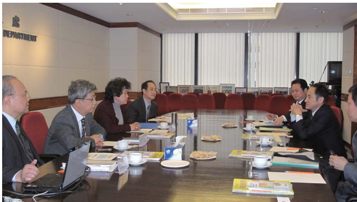
勞工處人員與廣東省安全生產監督管理局代表團會面