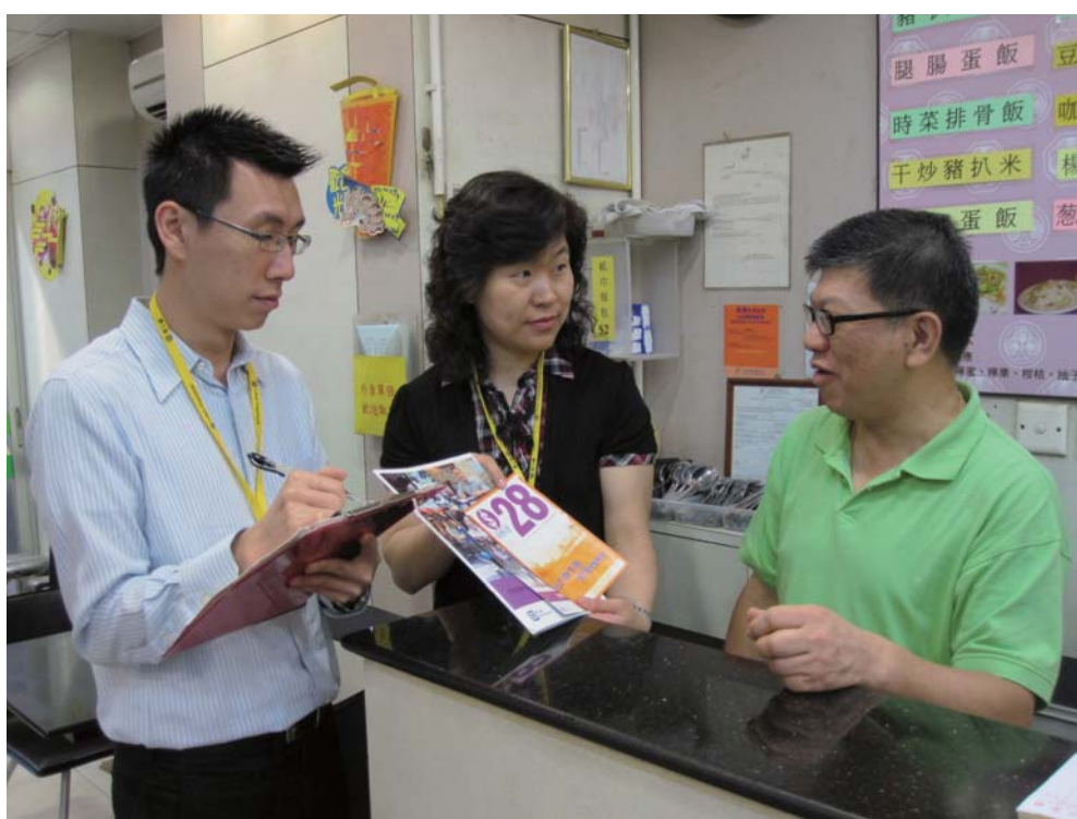
勞工督察在巡查一間食肆期間解釋《最低工資條例》的規定

1.15 配合首個法定最低工資的實施，勞工處採取多管齊下的策略，包括主動視察各行各業的工作場所及對低收入行業採取針對性執法行動，以保障僱員的權益。