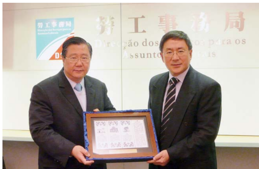
勞工處處長卓永興(右)與前澳門特別行政區勞工事務局局長孫家雄(左)會面