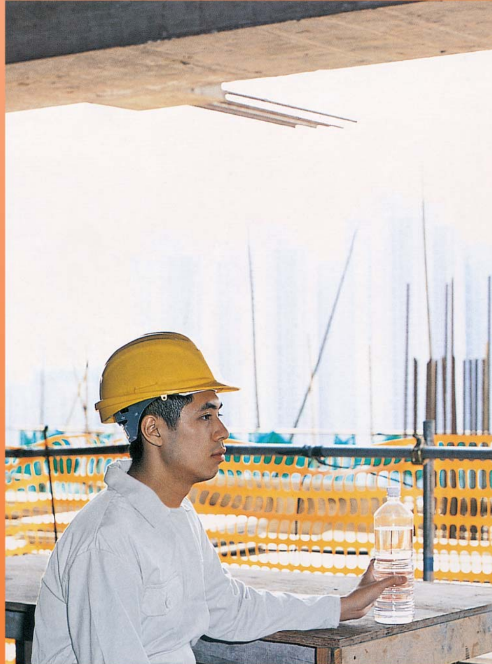
Magbigay ng sapat na maininom na tubig at sabihan ang mga manggagawa na uminom ng madalas.