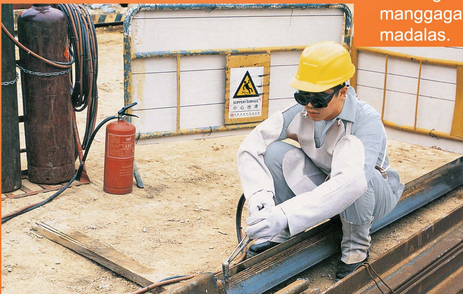
Itakda ang pagtatrabaho sa mga oras na presko ang panahon.