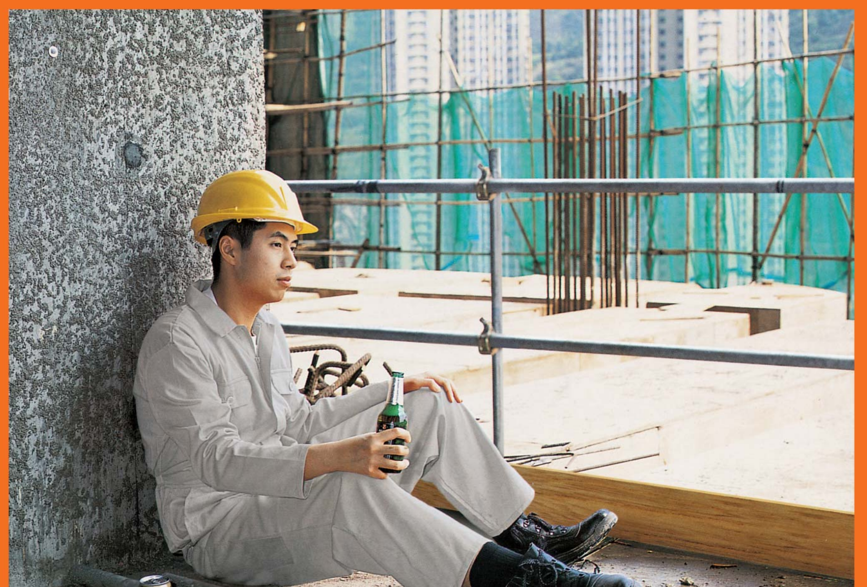
Dapat hindi uminom ng nakakalasing na inumin para maiwasan ang atake na dulot ng mainit na panahon.