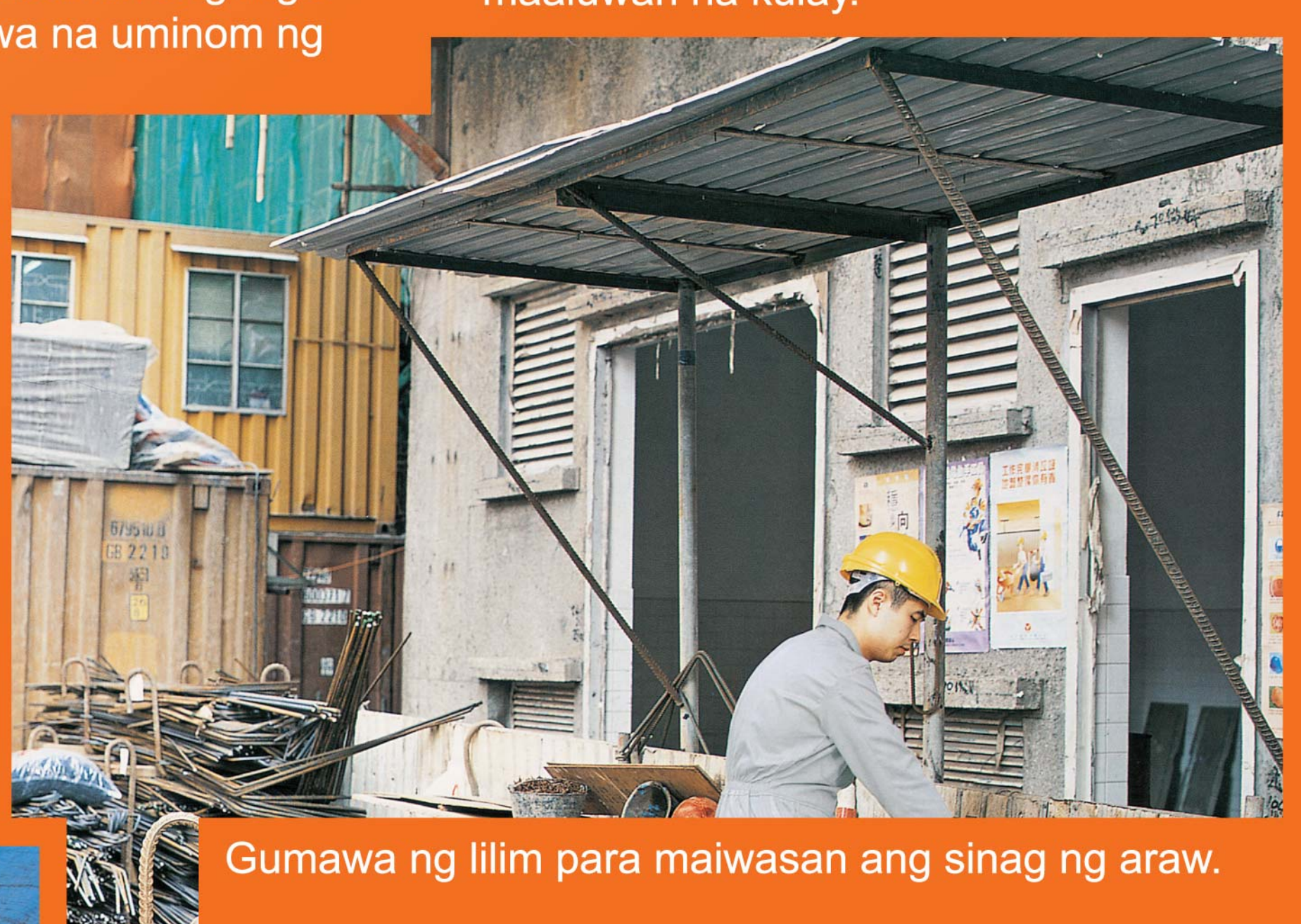
Gumawa ng lilim para maiwasan ang sinag ng araw.