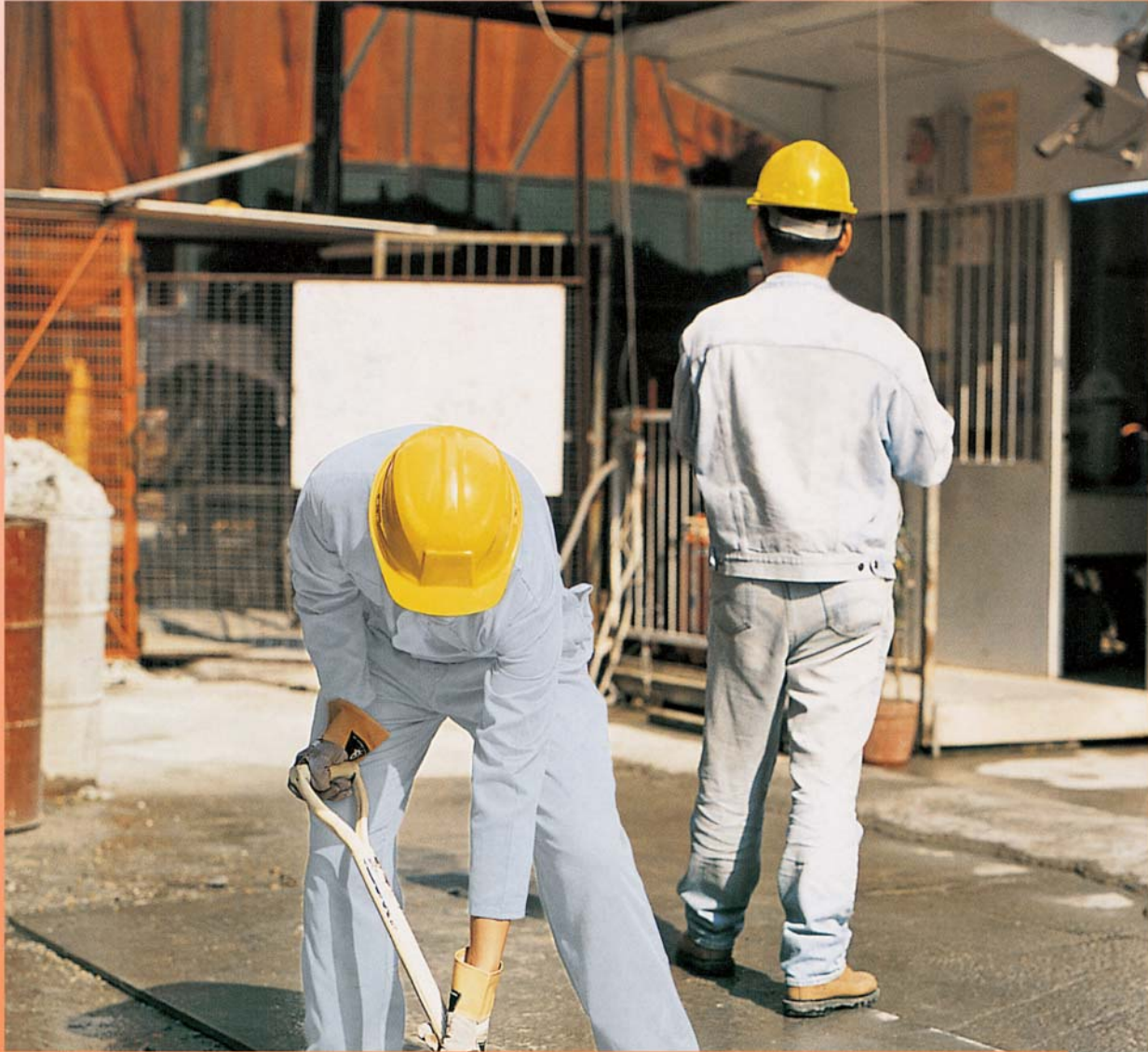
Tiyakin na ang mga manggagawa ay sanay na sa initan.