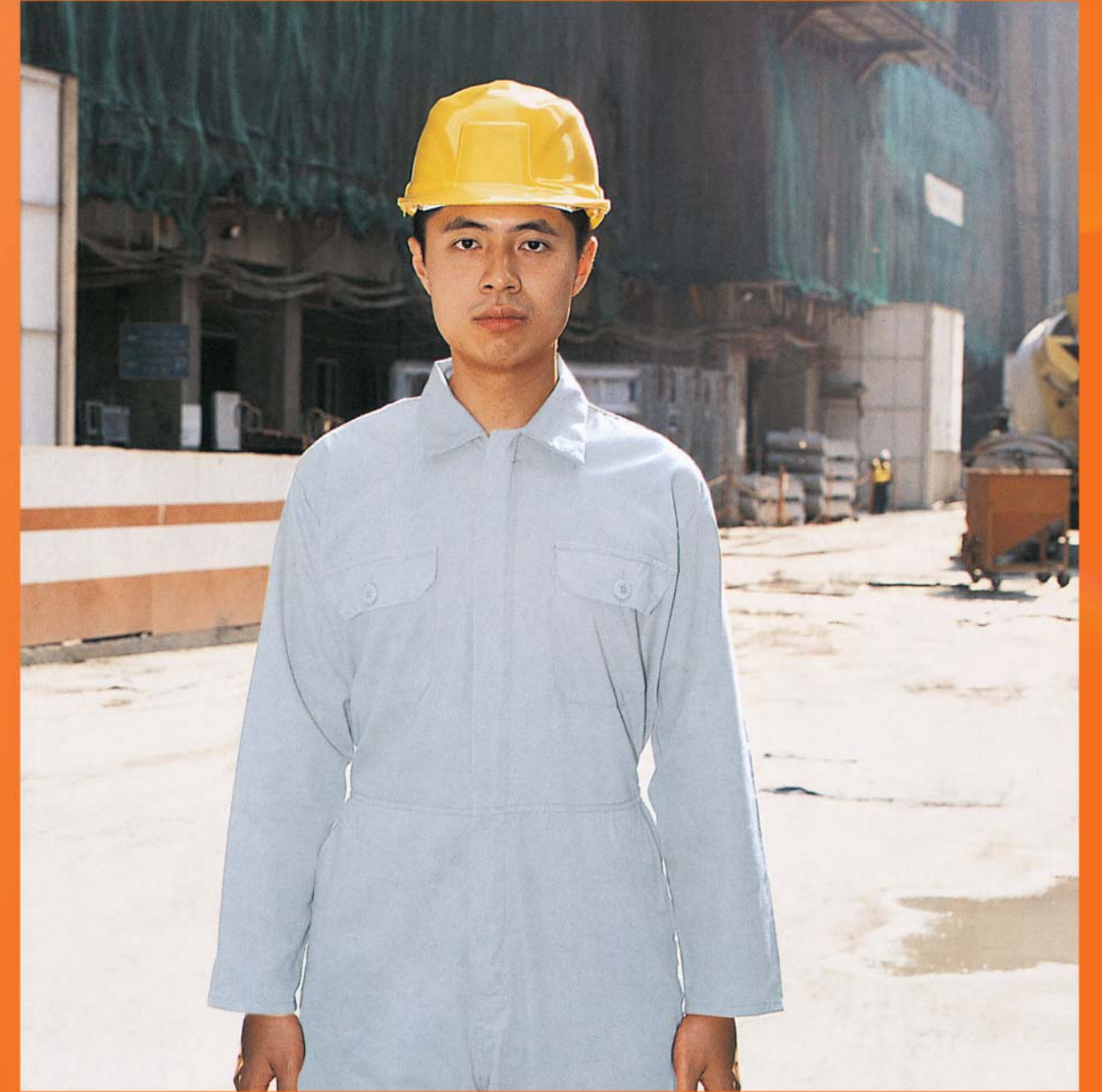
Ang mga manggagawa ay kailangang magsuot ng damit na maginhawa at may maaluwan na kulay.