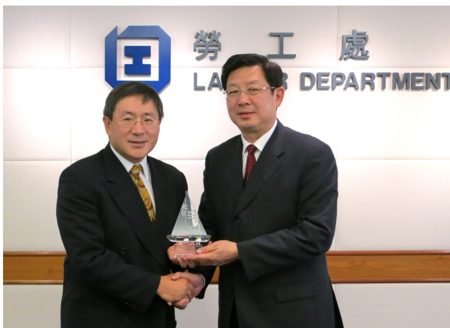
劳工处处长卓永兴（左）与人力资源和社会保障部胡晓义副部长（右）会面

1.29 十一月，国务院人力资源和社会保障部（简称「人社部」）胡晓义副部长获政府邀请访问香港特别行政区（简称「香港特区」），并与劳工处处长卓永兴及劳工处人员就劳工事务范畴进行交流。