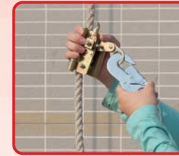
獨立救生繩及防墮裝置