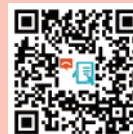
網上職安健投訴表格