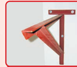
狗臂架必須裝上最少三顆繫穩螺絲