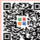
「職安健2.0」流動應用程式