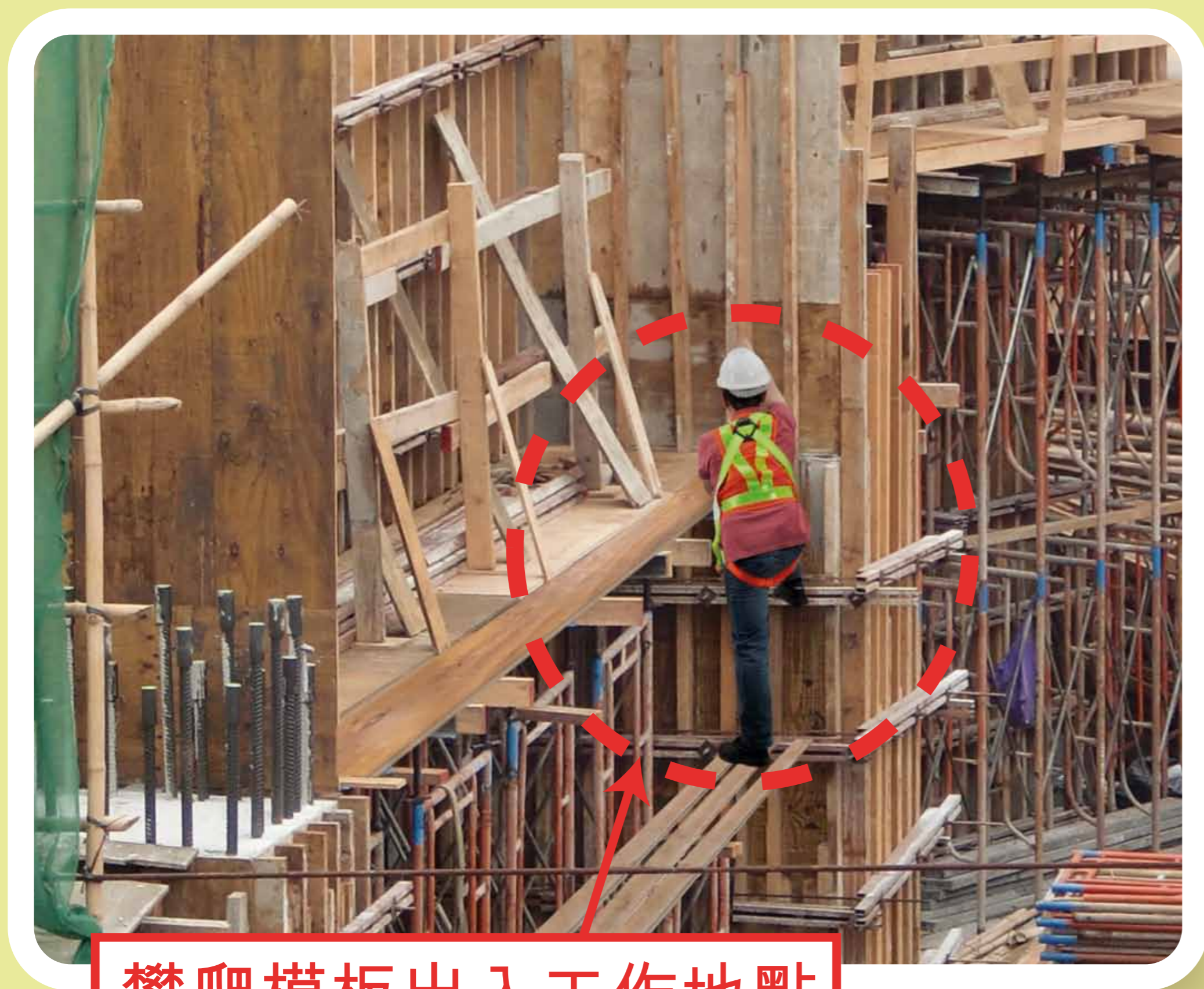
攀爬模板出入工作地點