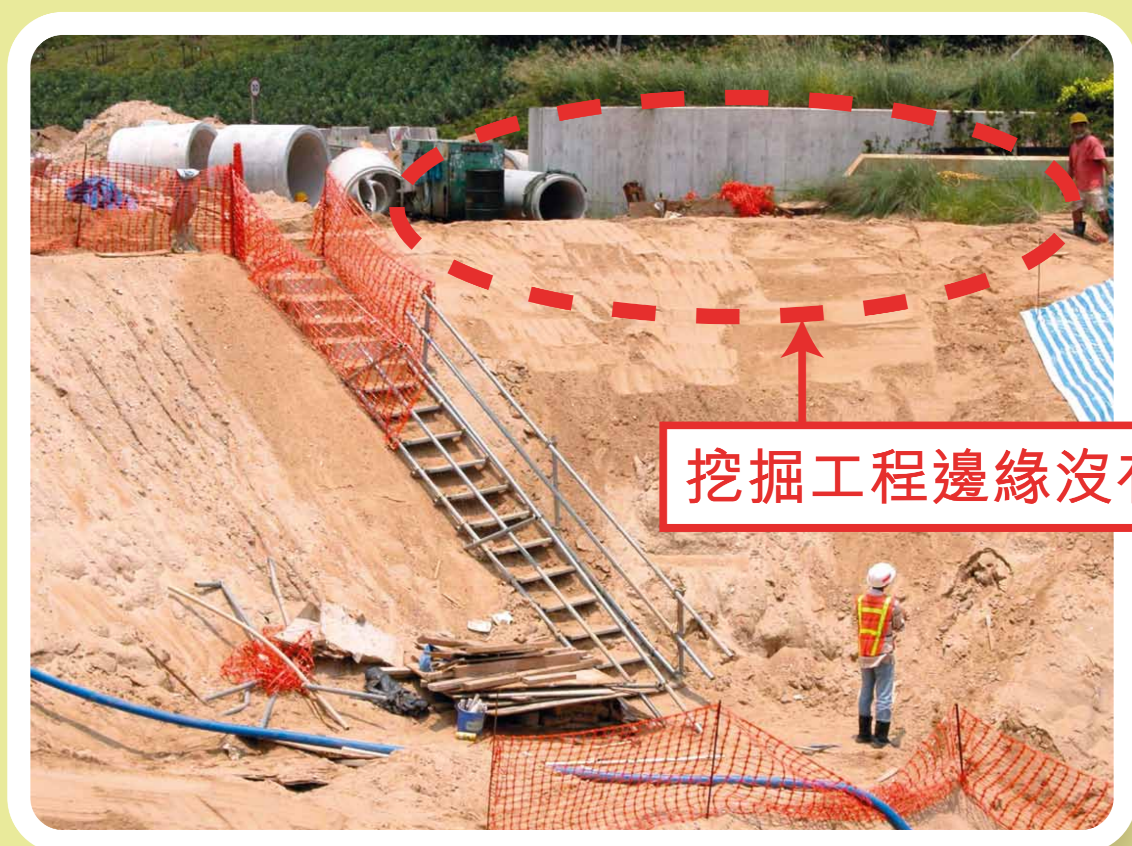
挖掘工程邊緣沒有屏障