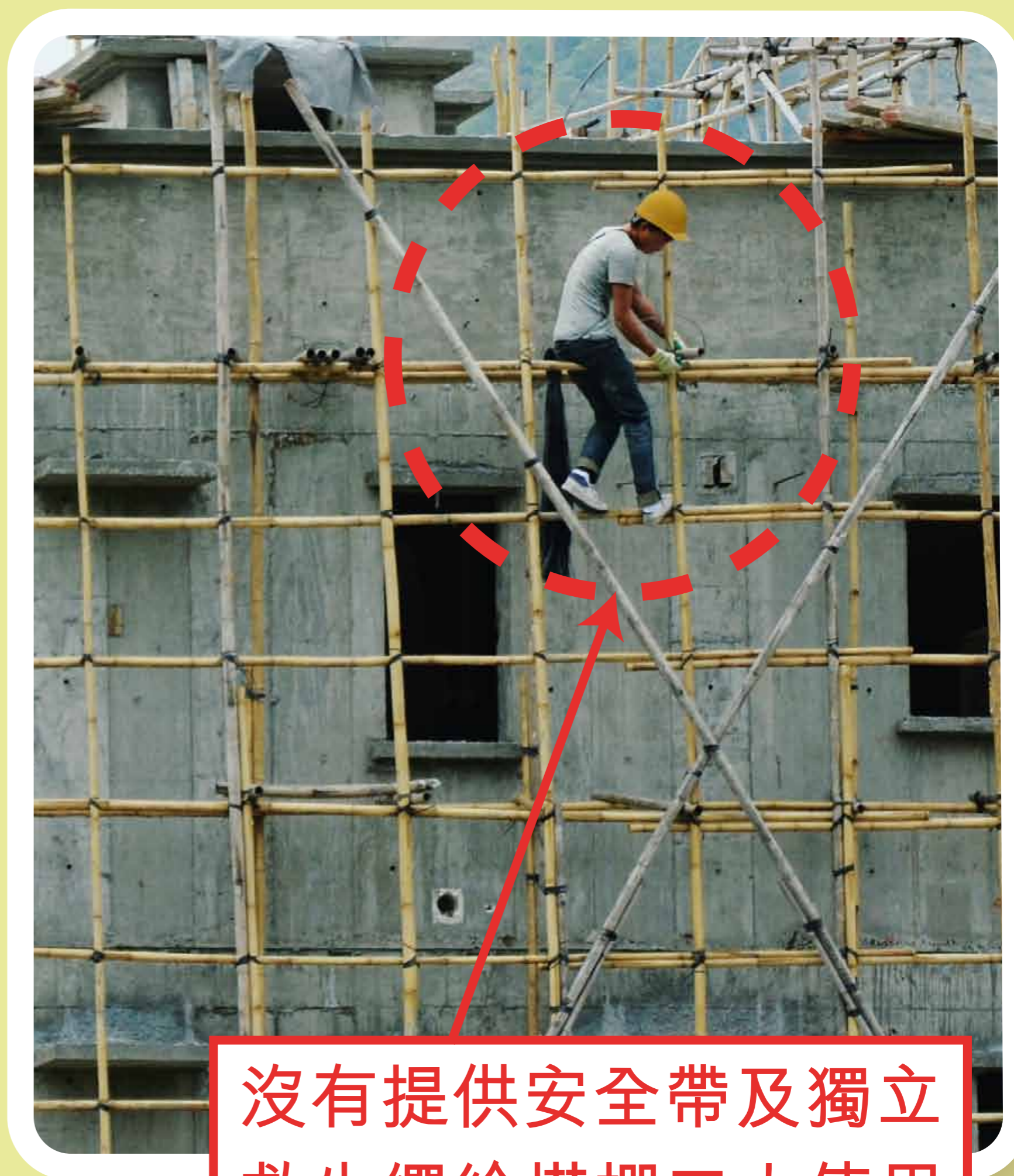
沒有提供安全帶及獨立 救生繩給搭棚工人使用