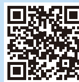
網上職安健投訴表格

如有任何關於工作地點的不安全作業模式或環境狀況的投訴，請致電勞工處職安健投訴熱線 2542 2172 或在勞工處網站填寫並遞交網上職安健投訴表格。所有投訴均會絕對保密。