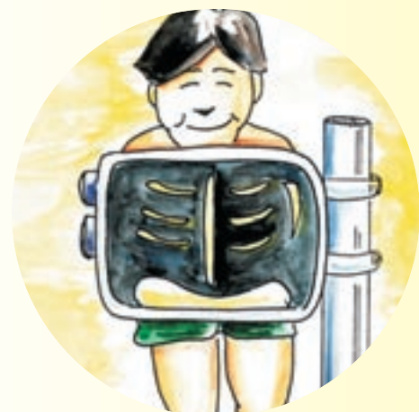
- 相關的化驗及放射檢驗