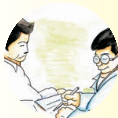
- 詳細的就業及患病歷史