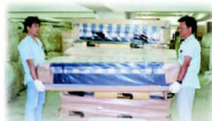
有系統的集體提舉可減少單獨搬運對個別員工的體力負擔。