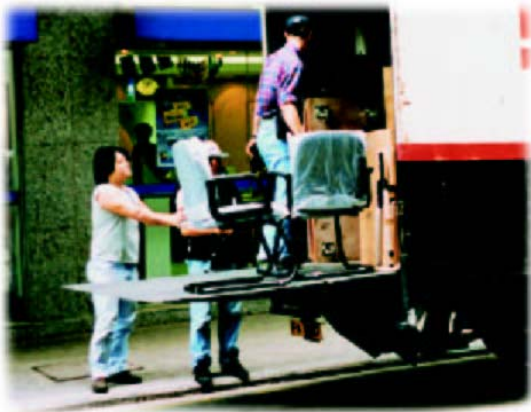
附有尾板升降台的貨車能便利家具上落。