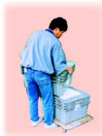
為配合手推車的使用，可用箱子盛載物件，整齊及穩固地放在車上，方便推動。