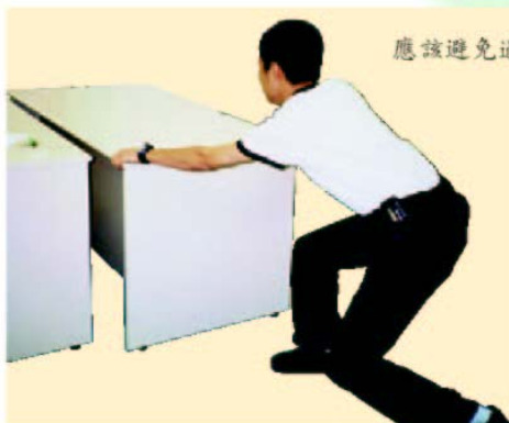
應該避免過度用力推動或拉動家具。