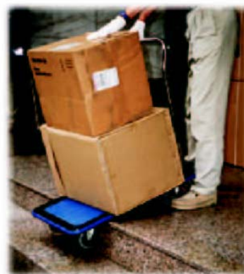
梯級會妨礙手推車的使用。