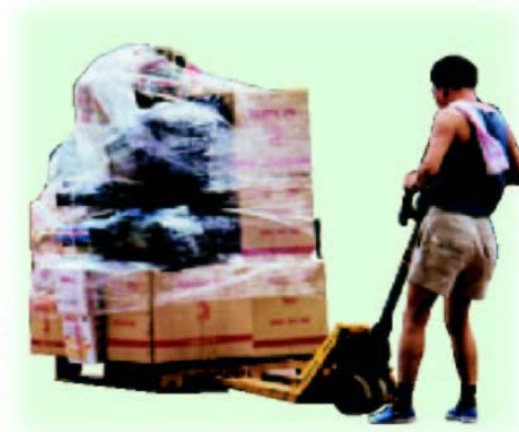
有需要時，可使用繩帶或膠紙牢固物件於手推車上，以免物件於車子移動時跌下而造成危險。