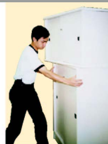
勉強搬動過大、不穩定、或過重的家具會對身體構成傷害。