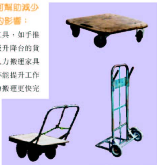
不同類型的手推車能符合不同工作的需要，可減少只倚靠人力搬運家具。