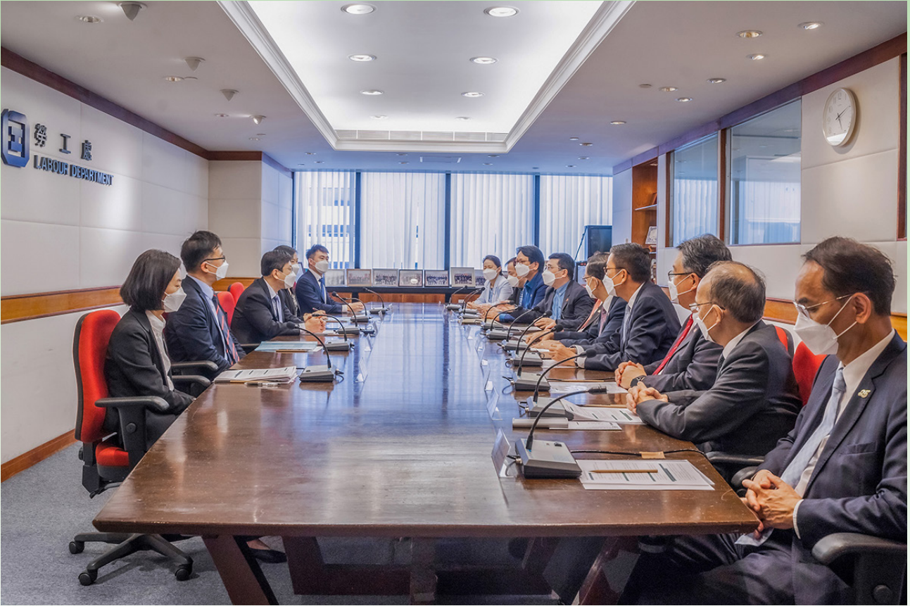
勞工顧問委員會會議