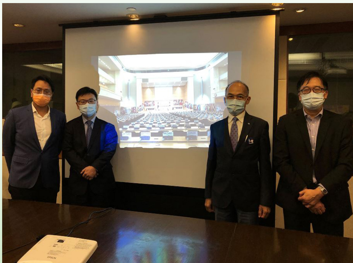
以視像形式出席第109屆國際勞工大會的香港特區代表

國際勞工組織有181個成員國派出政府、僱主和僱員代表參與視像大會，參與人數約4 500名。香港特區代表參與大會的全體會議及有關的委員會會議，包括標準實施委員會、關於「社會保護（社會保障）」的周期性討論委員會、勞動世界峰會，以及探討「不平等和勞動世界」和「技能和終身學習」兩項議題的一般性討論委員會。