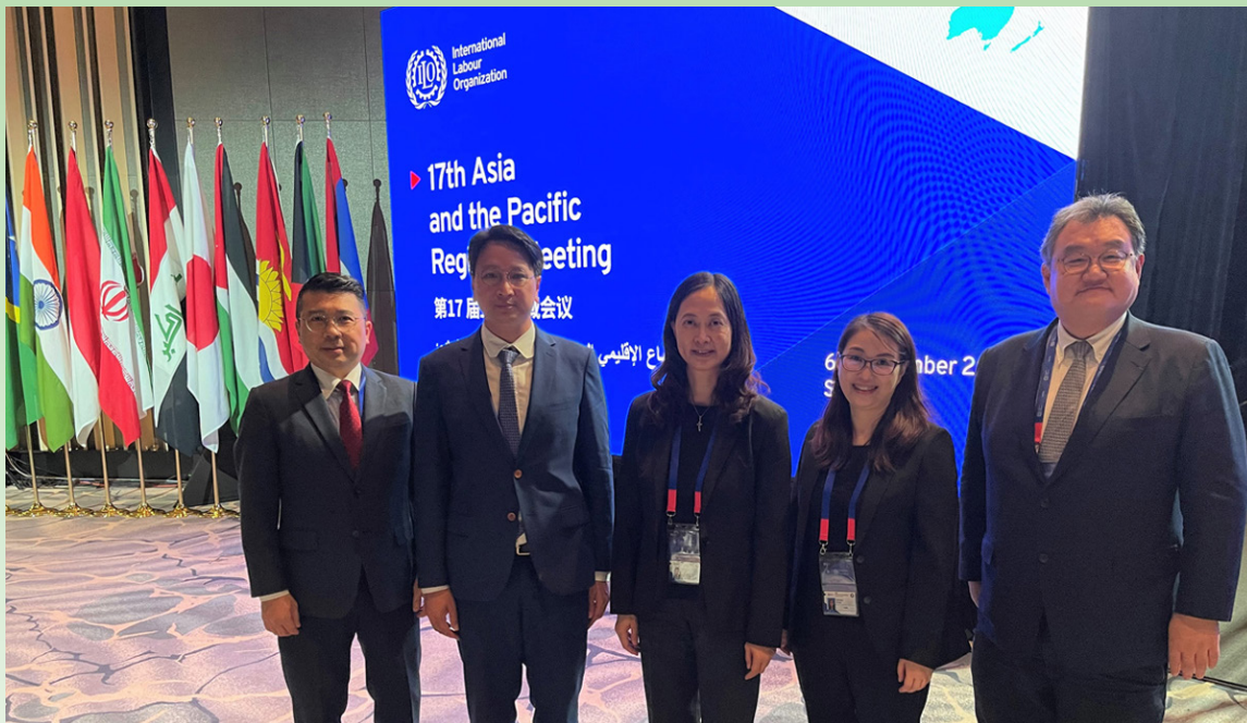
出席國際勞工組織第17屆亞太區域會議的香港特區代表

約有380名來自35個成員國的政府、僱主和僱員代表出席會議。香港特區代表出席亞太區域會議的全會會議，並參與專題性及特別全會討論會。