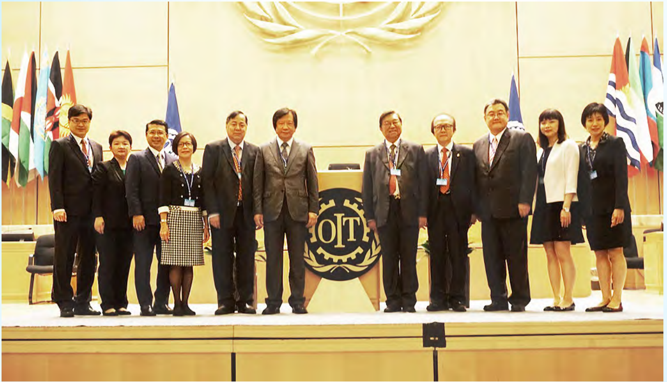
出席第105屆國際勞工大會的香港特區代表

國際勞工組織有187個成員國派出政府、僱主和僱員代表出席大會，參與人數約6 000名。香港特區代表出席大會的全體會議，並參與標準實施委員會、全球供應鏈中的體面勞動委員會、向和平過渡的就業和體面勞動委員會、社會正義宣言委員會及勞動世界峰會的會議。