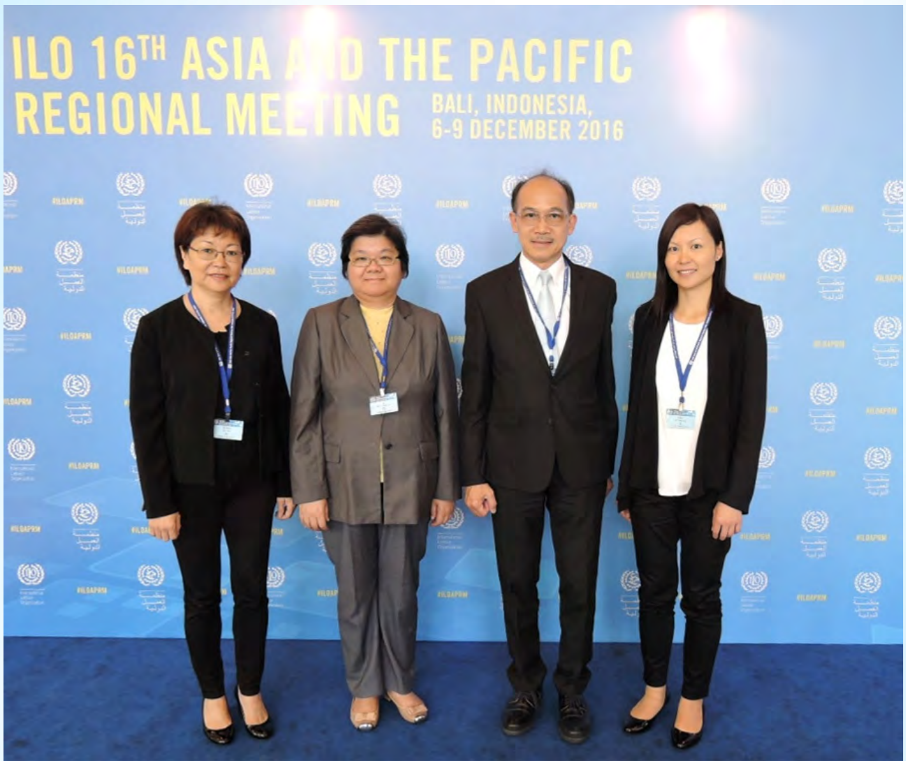
出席國際勞工組織第16屆亞太區域會議的香港特區代表

約有350名來自37個國家／地區政府、僱主和僱員代表出席會議。香港特區代表出席會議的全會會議，並參與高層對話、情況介紹會及特別全會討論會。