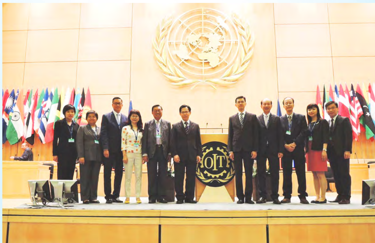
出席第104屆國際勞工大會的香港特區代表