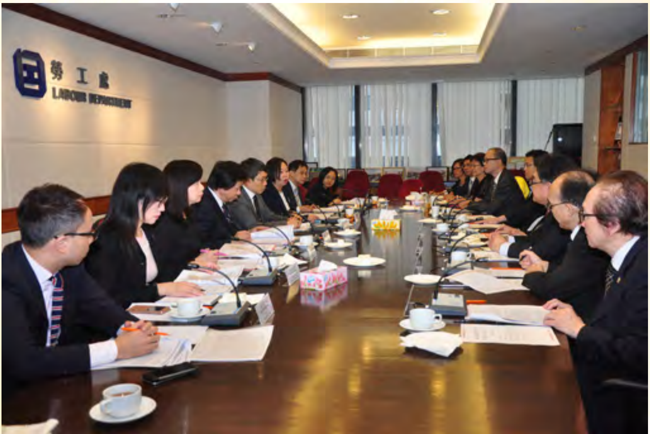
勞工顧問委員會會議

因應上述情況，勞顧會委員的委任公告已分別在2014年12月19日、2015年3月20日及2016年7月15日的政府憲報刊登。