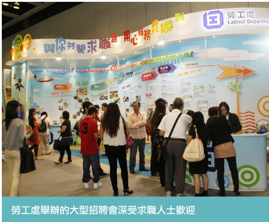
勞工處舉辦的大型招聘會深受求職人士歡迎