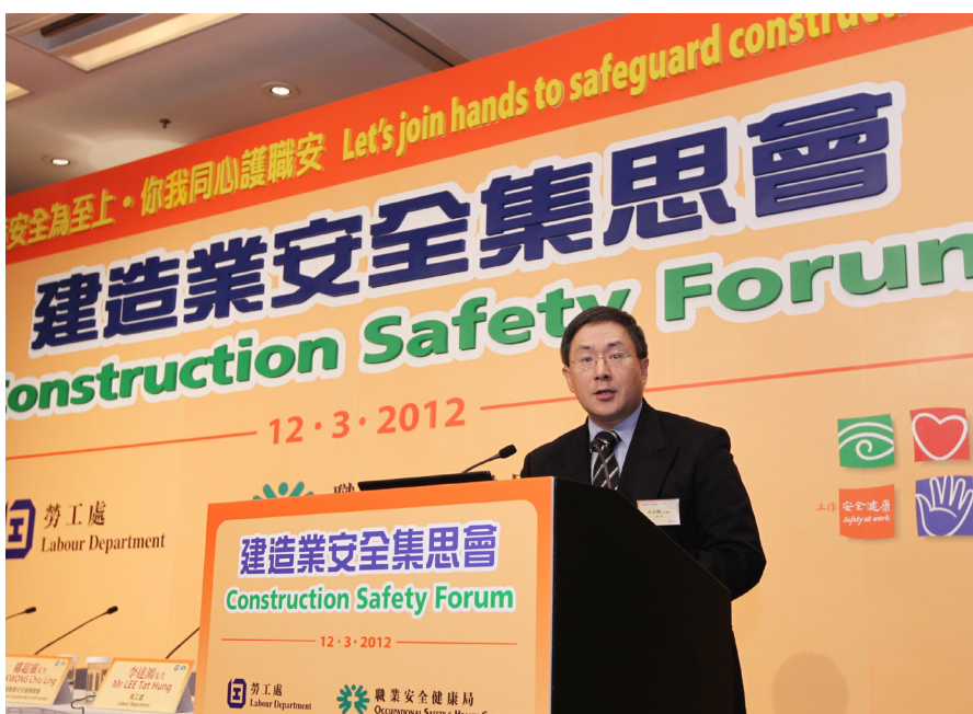
建造業安全集思會

1.21 勞工處與職安局於二零一二年三月舉辦「建造業安全集思會」，讓業界人士共同探討如何進一步提升建造業的職業安全水平。集思會有逾700人出席，並達成現正分階段落實的八項共識。