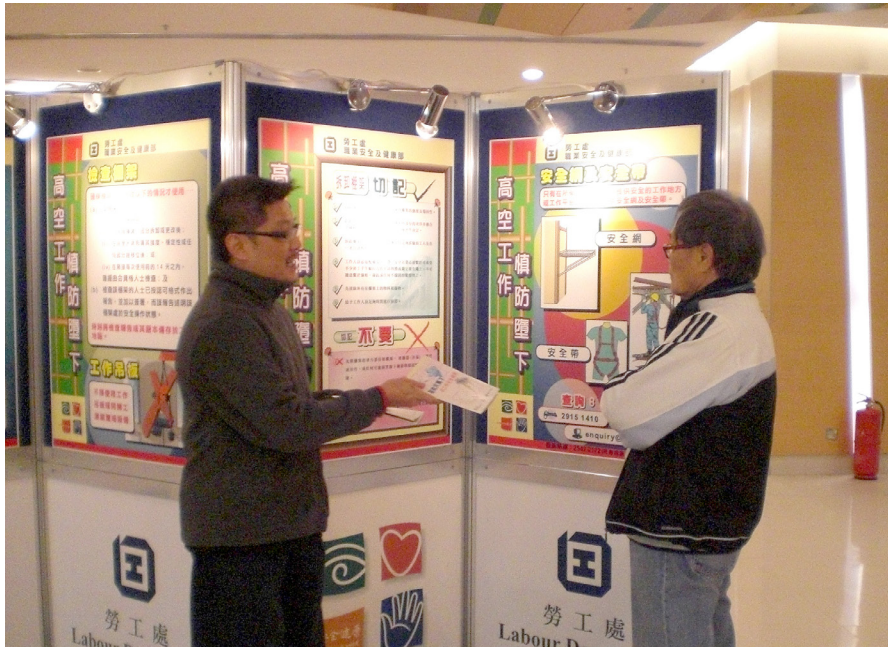
在各區商場進行裝修及維修工程安全巡迴展覽

1.20 在教育及宣傳方面，我們推行了一系列針對高空工作和裝修及維修工程的大型推廣及宣傳活動，以提高業界的安全意識，當中包括聯同職業安全健康局（簡稱「職安局」）繼續推行於二零一零年展開的兩年宣傳計劃，以嶄新的活動，將裝修及維修工程和高空工作安全的重要性，更直接地傳達給承建商與工人。我們亦與區議會／民政事務處、各區的「安全健康社區」及物業管理界建立夥伴關係，從地區層面推行針對高空工作和裝修及維修工程安全的宣傳推廣工作。