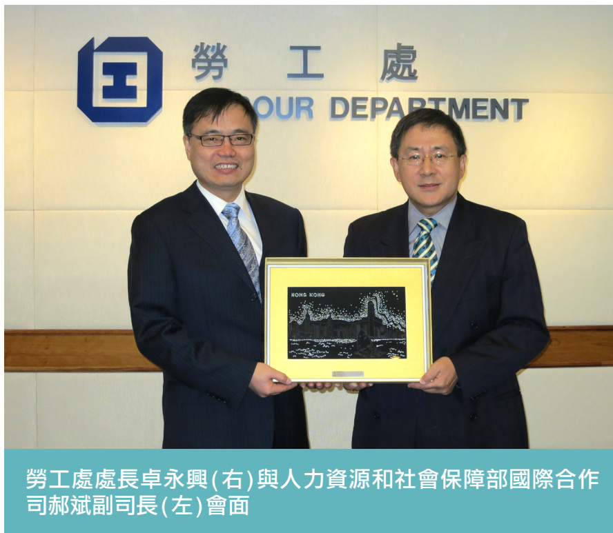
勞工處處長卓永興(右)與人力資源和社會保障部國際合作司郝斌副司長(左)會面

1.31 十二月，人社部國際合作司郝斌副司長率領代表團，根據互訪計劃訪問香港特區，與勞工處處長卓永興及勞工處人員就處理國際勞工事務進行交流。