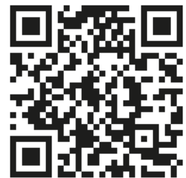
网上职安健投诉表格

如有任何关于工作地点的不安全作业模式或环境状况的投诉，请致电劳工处职安健投诉热线2542 2172或在劳工处网站填写并递交网上职安健投诉表格。所有投诉均会绝对保密。