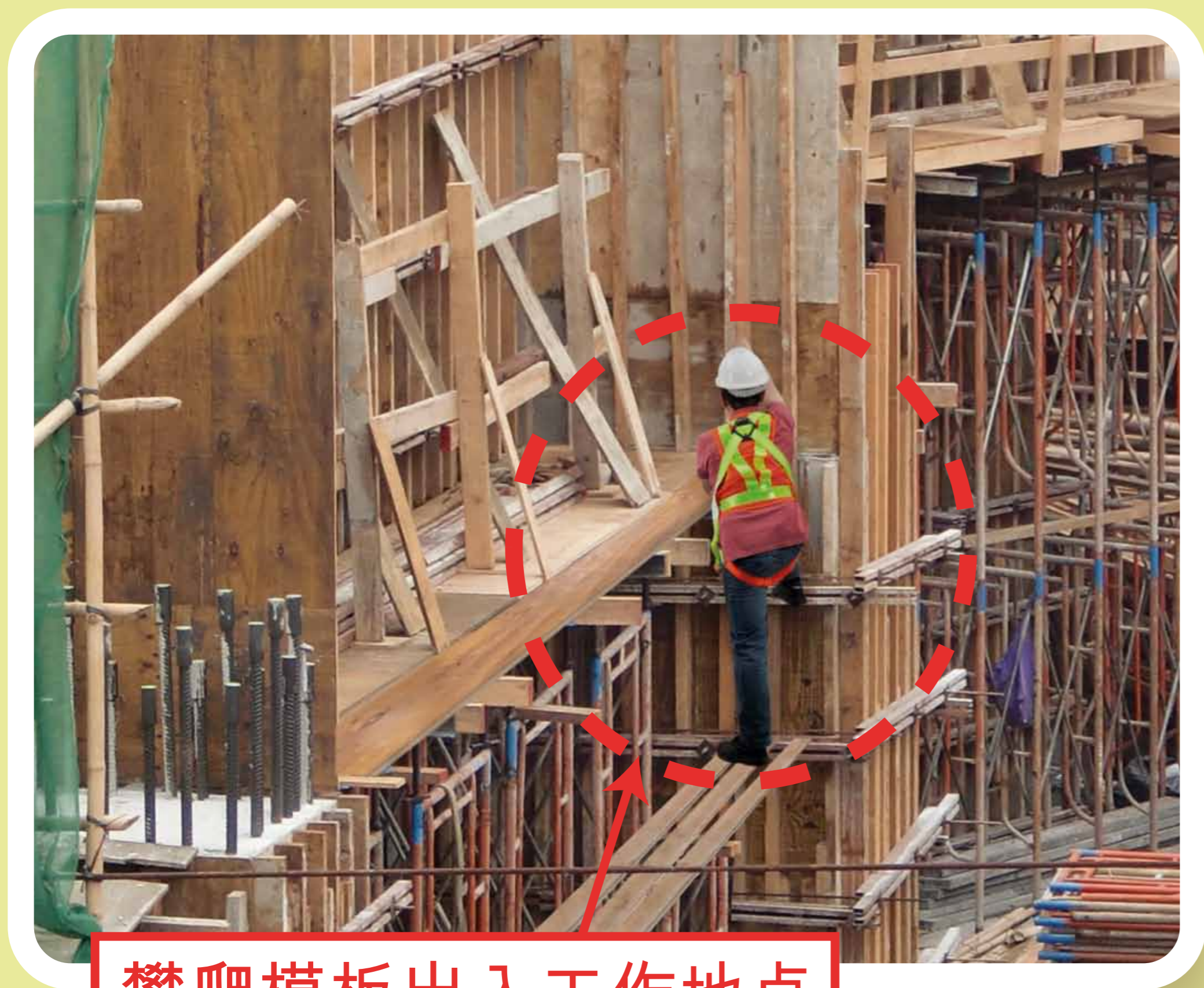
攀爬模板出入工作地点