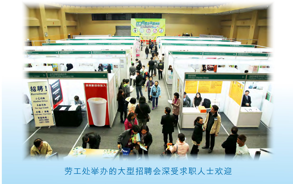
劳工处举办的大型招聘会深受求职人士欢迎