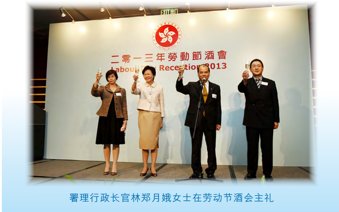
署理行政长官林郑月娥女士在劳动节酒会主礼

1.29 劳工及福利局局长张建宗于二零一三年四月二十六日在香港会议展览中心举行劳动节酒会，表扬劳工界的贡献。酒会由署理行政长官林郑月娥主礼，出席嘉宾包括职工会、雇主联会和其他机构的代表。