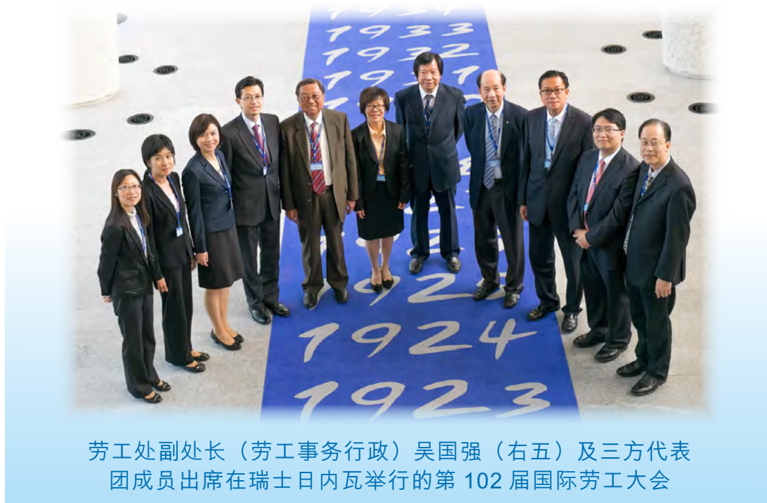
劳工处副处长（劳工事务行政）吴国强（右五）及三方代表团成员出席在瑞士日内瓦举行的第102届国际劳工大会

1.31 六月，劳工处副处长(劳工事务行政)吴国强率领一个由政府、雇主及雇员三方组成的代表团，以中华人民共和国代表团成员的身份，出席在瑞士日内瓦举行的第102届国际劳工大会。