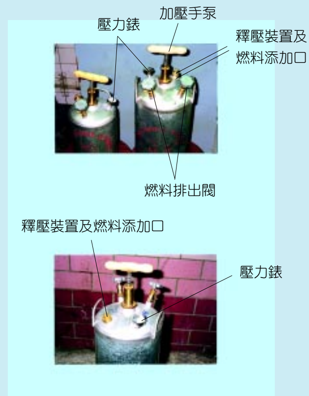
圖一：壓力燃料容器的一般裝置